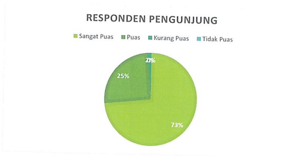
Diagram Indeks Kepuasan Masyarakat (IKM)

Bahwa berdasarkan grafik dan diagram sebagaimana tersebut di atas dapat diketahui tingkat Kepuasan Masyarakat pada Pengadilan Negeri / PHI / Tipikor Serang Kelas IA cukup memuaskan dikarenakan dari seluruh pengguna yang mendatangi Pengadilan Negeri / PHI / Tipikor Serang Kelas IA untuk mendapatkan pelayanan hukum sebanyak total jumlah responden pengguna 289 (Dua Ratus Delapan Puluh Sembilan) orang, jumlah responden yang merasa sangat puas sebanyak 212 (Dua Ratus Dua Belas) orang, Puas 73 (Tujuh Puluh Tiga) orang, Kurang Puas sebanyak 4 (Empat) orang dan tidak puas tidak ada dengan perolehan persentase jumlah responden pengguna yang merasa sangat puas dengan pelayanan hukum