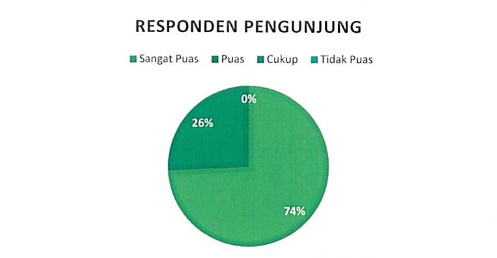
Diagram Indeks Kepuasan Masyarakat (IKM)

Bahwa berdasarkan grafik dan diagram sebagaimana tersebut di atas dapat diketahui tingkat Kepuasan Masyarakat pada Pengadilan Negeri / PHI / Tipikor Serang Kelas IA cukup memuaskan dikarenakan dari seluruh pengguna yang mendatangi Pengadilan Negeri / PHI / Tipikor Serang Kelas IA untuk mendapatkan pelayanan hukum sebanyak total jumlah responden pengguna 66 (enam puluh enam) orang, jumlah responden yang merasa sangat puas sebanyak 49 (empat puluh sembilan) orang, Puas 17 (tujuh belas) orang, Kurang Puas sebanyak 0 (nol) orang dan tidak puas tidak ada dengan perolehan persentase jumlah responden pengguna yang merasa sangat puas dengan pelayanan hukum Pengadilan Negeri / PHI / Tipikor Serang Kelas IA sebesar 74% (tujuh puluh tiga) persen.