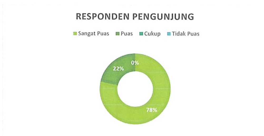
Diagram Indeks Kepuasan Masyarakat (IKM)

Bahwa berdasarkan grafik dan diagram sebagaimana tersebut di atas dapat diketahui tingkat Kepuasan Masyarakat pada Pengadilan Negeri / PHI / Tipikor Serang Kelas IA cukup memuaskan dikarenakan dari seluruh pengguna yang mendatangi Pengadilan Negeri / PHI / Tipikor Serang Kelas IA untuk mendapatkan pelayanan hukum sebanyak total jumlah responden pengguna 102 (seratus dua) orang, jumlah responden yang merasa sangat puas sebanyak 80 (delapan puluh) orang, Puas 22 (dua puluh dua) orang, Kurang Puas sebanyak 0 (nol) orang dan tidak puas tidak ada dengan perolehan persentase jumlah responden pengguna yang merasa sangat puas dengan pelayanan hukum Pengadilan Negeri / PHI / Tipikor Serang Kelas IA sebesar 78% (tujuh puluh delapan) persen.